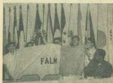
Las delegaciones de Venezuela y Vietnam intercambian símbolos de la lucha de uno y otro pueblo, entre las aclamaciones de los presentes: ametralladora de los guerrilleros venezolanos a los vietnamitas y banderas de estos últimos para los venezolanos.

Destacando el propósito de "sangre sin revolución, que es el antimperialismo que la UFUCH proclama", la Federación Estudiantil Universitaria de Cuba, dió merecida y valiente contestación al Comité Ejecutivo de la reaccionaria UFUCH. Dice la carta de la FEU: