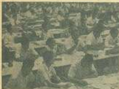
Los delegados al IV CLAE durante una de las sesiones plenarias.