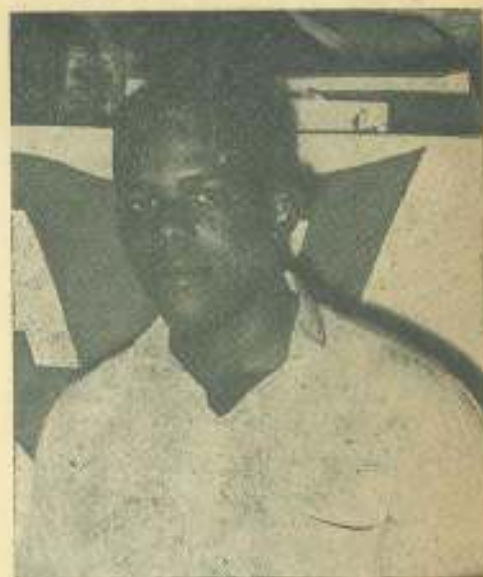
El delegado observador del Instituto de Ciencias Básicas "Victoria de Girón".

Entre las numerosas Resoluciones aprobadas por unanimidad en la plenaria final del IV CLAE fueron votadas