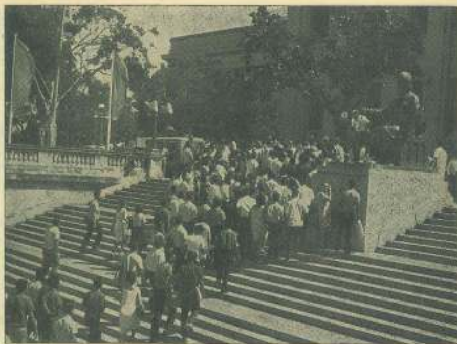
Los delegados al Congreso Latinoamericano de Estudiantes cuando llegaban a la escalinata de la Universidad de la Habana.