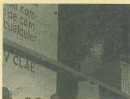
El comandante Pedro Miret, miembro del Comité Central del Partido, usando de la palabra en el acto efectuado en el estado "Juan Abarantes", en homenaje a los delegados del Congreso.

Tras desear éxitos al Congreso, Miret pidió que el Congreso sea "fiel llamada que agrupe las voluntades dispersas y las lance a la lucha y recordó