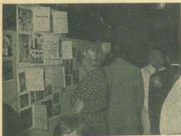
En el vestíbulo de la Sala "Tespis" el público se informó de los 25 años de Teatro Universitario a través de una Exposición.

cipación está tan cercana que poco empieza a pesar el sentido de responsabilidad. Es posible y probable que una mujer de 25 verdes todavía no los oculte ni se los reste.