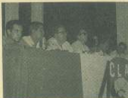
Presidencia del acto del Instituto "Victoria de Girón", en el que se eligió el delegado observador al IV CLAE.

3. Intercambios y relaciones. Medidas tendientes a fomentar y desarrollar la solidaridad efectiva dentro del movimiento estudiantil latinoamericano: