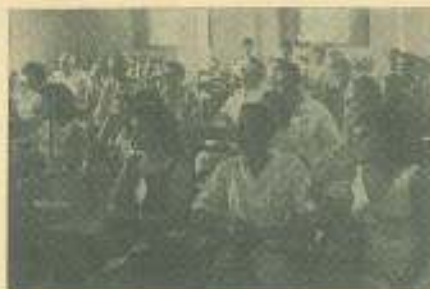
En el Instituto Pedagógico "Enrique José Varona", se ofreció un encuentro con delegados del Congreso Latinoamericano de Estudiantes.

Para condenar una resolución de la Cámara de Representantes de Estados Unidos en que se postula la continuación de la política intervencionista estadounidense, el Congreso estudiantil aprobó unánimemente una Resolución en que proclama "el derecho de todos