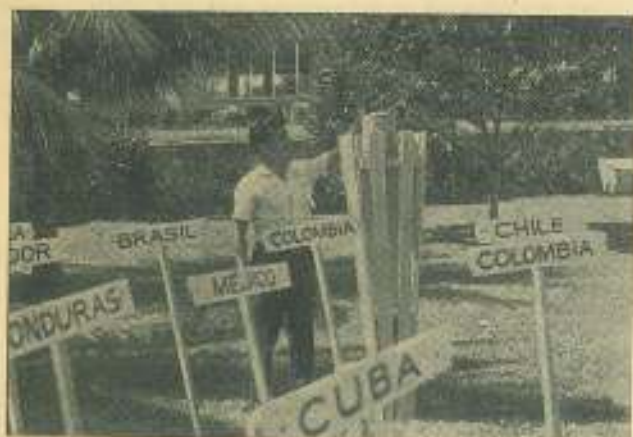
Un alumno latinoamericano de la Universidad Central de Las Villas, miembro del Comité Preparatorio del IV CLAE de ese centro docente, cuando encendía la antorcha en el parque universitario villareño, la cual permaneció encendida mientras duró el gran evento llevado a cabo en La Habana.