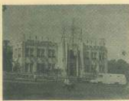
La Escuela de Medicina Veterinaria se vestía de gala para saludar a los delegados.