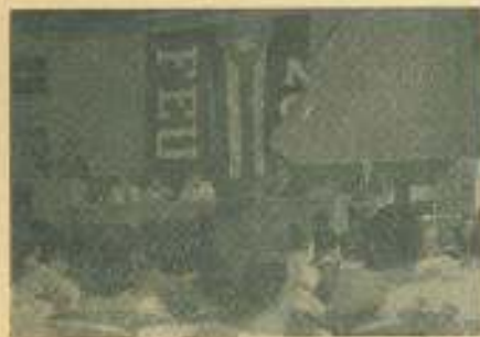
Aspecto del acto efectuado en el anfiteatro "Sanguily" donde las autoridades universitarias recibieron a los estudiantes que asisten al IV CLAE.