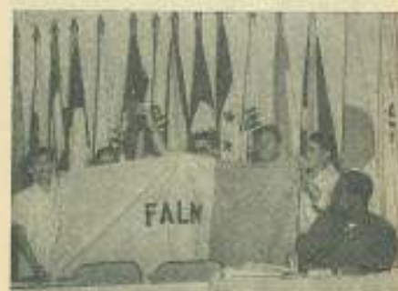
Las delegaciones de Venezuela y Vietnam intercambian símbolos de la lucha de uno y otro pueblo, entre las aclamaciones de los presentes: ametralladora de los guerrilleros venezolanos a los vietnamitas y banderas de estos últimos para los venezolanos.

Destacando el propósito de "sangre sin revolución, que es el antimperialismo que la UFUCH proclama", la Federación Estudiantil Universitaria de Cuba, dió merecida y valiente contestación al Comité Ejecutivo de la reaccionaria UFUCH. Dice la carta de la FEU: