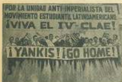
Así saludaron los estudiantes universitarios al IV CLAE.

aprobado por el Comité Ejecutivo de la U. I. E., reunido en El Cairo. En ese sentido se tomarán todas las medidas necesarias para garantizar que éste se cumpliera efectivamente en los países latinoamericanos.