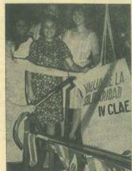
Valija de la Solidaridad de Ciencias Políticas para delegados al IV CLAE, con obsequios.

descargarán los pueblos sobre el imperialismo".