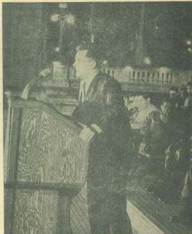
Armando Hart, Secretario organizador y miembro del Buró Político del P.C., que hizo el resumen del acto de clausura.

Habla del papel de avanzada del estudiantado latinoamericano y de cómo ha ido desbaratando los diversos planes del imperialismo, interesado en neutralizar esa fuerza. "Este IV CLAE —dice— es una prueba más del grado de madurez y de conciencia antimperialista que tiene el estudiantado latinoamericano". Y más adelante, agrega que la "Declaración General del IV Congreso constituye uno de los documentos más profundos de carácter antimperialista que se haya aprobado en reunión internacional alguna. Puede decirse que el estudiantado latinoamericano, al aprobar esa Declaración General y las resoluciones que acordaron, ha fijado con gran profundidad, con gran precisión, una alta conciencia antimperialista". ... "Y es que los estudiantes latinoamericanos han enten-