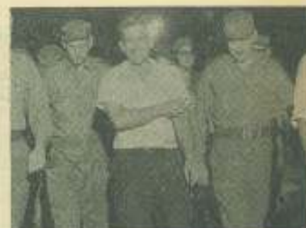
El comandante Pedro Miret y el secretario general de la UJC, Jaime Crombet, began el estadio universitario para asistir al desfile militar de la reserva estudiantil universitaria.

la sangre de nuestros mártires se gestaron en gran parte casi todos los movimientos revolucionarios anteriores a la Revolución liberadora. El estudiantado, pues, —añadió— jugó un papel principalísimo en la gesta liberadora. Ocupamos en el momento necesario el papel que exigieron las condiciones históricas. Y fue el estudiantado lo único que podía ser: clarinada en la lucha revolucionaria, ejemplo en el heroísmo, vanguardia combativa de todo el pueblo".