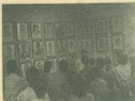
Delegados del Congreso, en el Salón de los Mártires de la FEU.

Con palabra serena inició el comandante Pedro Miret su discurso resumen de la magnífica revista militar de los estudiantes universitarios, expresando "con honda y justificada satisfacción el más caluroso y fraternal saludo de todos los combatientes de nuestras Fuerzas Armadas Revolucionarias, a sus hermanos de Latinoamérica confiados en que este Congreso será un nuevo golpe que