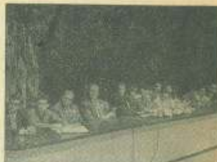
En el teatro "García Lorca" se efectuó un CLAE simbólico por los estudiantes de la Escuela de Medicina de la Universidad de la Habana.

Al calificar el papel del estudiantado en las luchas populares de Cuba, el comandante Pedro Miret significó, aludiendo a la Universidad habanera que "tras esos viejos muros salpicados por