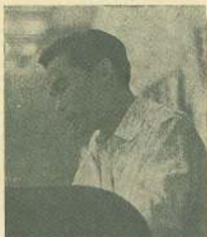
El delegado de Viet-Nam del Norte informando al Congreso.

Aprobado el Reglamento que rigió las sesiones de trabajo del Congreso y electa la mesa directiva, la primera moción presentada, aprobada unánimemente, fue la de la Federación de Centros Universitarios de Venezuela, de solidaridad con los estudiantes argentinos, agredidos por el régimen militar