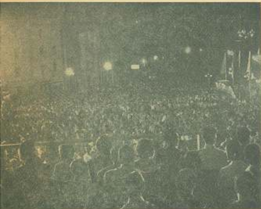
Aspecto del numeroso público que colmó la Escalinata Universitaria.