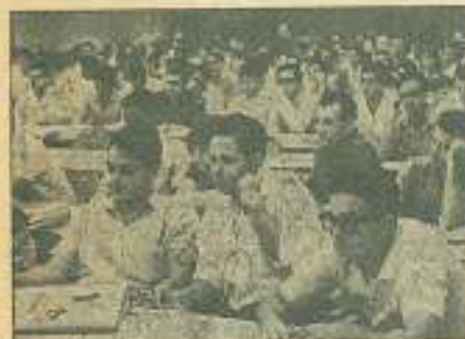
La delegación de Cuba escuchando los informes de los delegados.