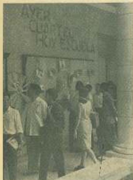
Delegados del IV CLAE visitaron el Instituto de Economía de la Universidad de la Habana.