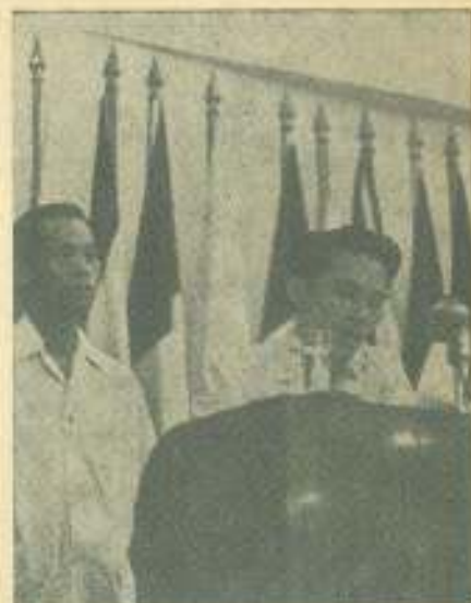
Momento en que informa el delegado de la delegación invitada de honor de Viet-Nam del Sur.

Asistieron al IV CLAE un total de 41 organismos y 145 delegados. Participaron 21 delegaciones plenas: Federación Universitaria Argentina, Federación de Estudiantes Universitarios de Ecuador, Federación de Estudiantes Dominicanos, Federación Universitaria Pro Independencia de Puerto Rico, Federación de Centros Universitarios Venezolanos, Federación Estudiantil de Panamá, Asociación General de Estudiantes Universitarios de El Salvador, Asociación de Estudiantes Universitarios de Guatemala, Federación de la Universidad de San Marcos de Perú, Confederación de Estudiantes de la Universidad Nacional de Nicaragua, Federación Nacional de Estudiantes Técnicos de México, Central Nacional de Estudiantes Demócratas de México, Unión General de Estudiantes Guaya-