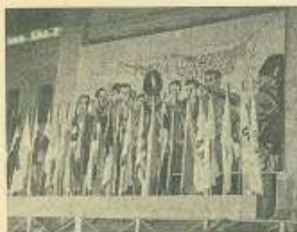
Mural que presidió el acto de la Escalinata con las banderas de los países representados en el IV CLAE.