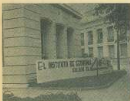
Un rincón de la colina universitaria, ostenta un saludo del Instituto de Economía.