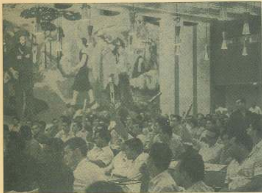
El Pleno en un momento de votación.