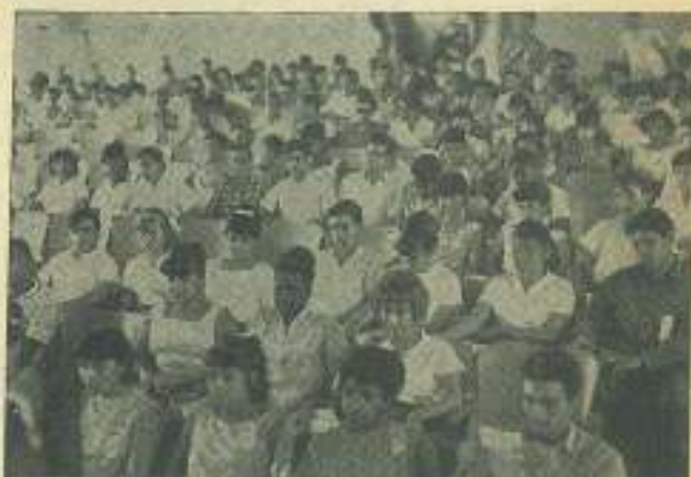
En la combinación gráfica aparecen alumnos y delegados al IV CLAE Simbólico durante el desarrollo del mismo. Y una vista de la presidencia, en la que ocuparon asientos dirigentes del Comité Universitario de la UJC y la FEUC, así como dirigentes provinciales de la UJC y la UES.