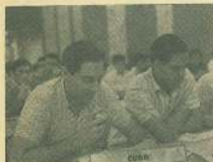
El presidente de la delegación de Cuba, Francisco Dorticós, cuando daba lectura el cable insidioso y divisionista enviado por la UFUCH.

Ustedes dicen en su cable que "Problemas fundamentales pueblo estudiantado latinoamericano exigen decidida acción unitaria grupos progresistas tras metas urgentes y comunes derrotar imperialismo norteamericano oligarquías, militarismo promover paz justicia social, superar miseria e ignorancia". Realmente señores de la UFUCH, estas afirmaciones en elementos como ustedes cuya filiación política es claramente conocida, aunque a veces ignorada, no puede surgir más que de maestros verdaderos de la demagogia. Ustedes no ignoran que precisamente este Congreso será la base para una acción unitaria del movimiento estudiantil revolucionario y antimperialista de América Latina.