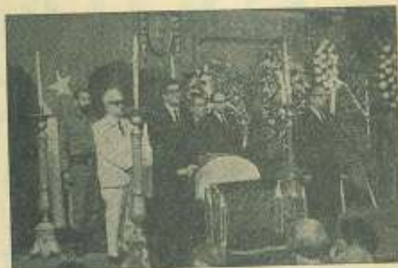
Guardia de Honor integrada por el Ministro de Relaciones Exteriores, Raúl Roa; el Embajador de Cuba en la "Unesco", Juan Marinello; los miembros del CC del PCC, Blas Roca y Carlos R. Rodríguez; el Presidente de la Academia Nacional de Ciencias, Antonio Nájuez Jiménez; y el Rector de la Universidad de la Habana, José M. Miyar Barruecos.