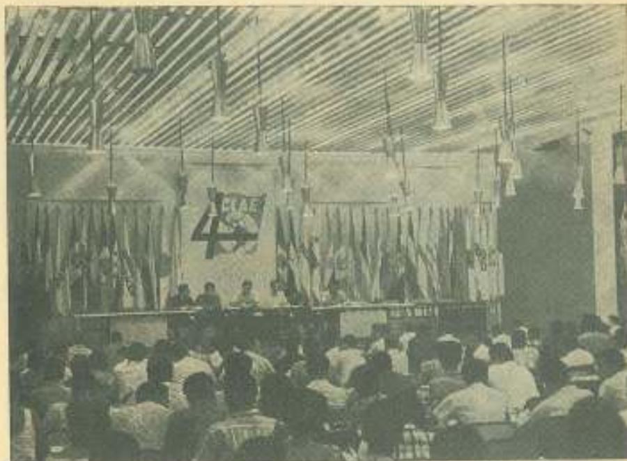
La delegación de Cuba presidió, por acuerdo unánime de todas las delegaciones, los trabajos del IV CLAE.

"Los problemas fundamentales del pueblo y estudiantado latinoamericano exigen decidida acción unitaria de los grupos progresistas tras metas urgentes y comunes, derrotar imperialismo norteamericano y oligarquías militaristas y promover la paz y justicia social, superar miseria, ignorancia y subdesarrollo. En este espíritu, la reunión Montevideo de noviembre de 1965 decidió fortalecer la unidad del movimiento estudiantil latinoamericano ce-