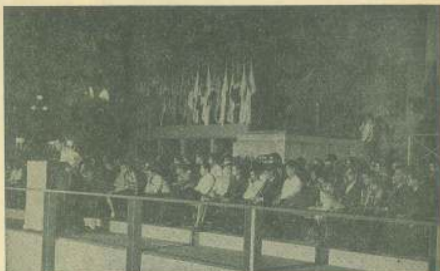
El Presidente de la FEU, Francisco Dorticós, leyendo la Resolución General del IV CLAE, y parte de los delegados estudiantiles que ocuparon asientos en la Presidencia del acto de clausura, en la Escalinata Universitaria.

¡Viva la lucha heroica del estudiantado latinoamericano!"