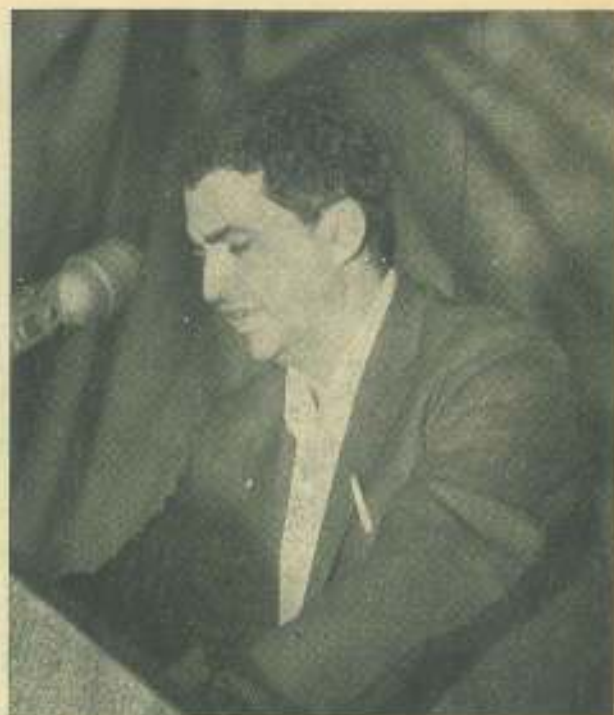
El Ministro de Educación, José Llanusa, dejó inaugurado el IV Congreso Latinoamericano de Estudiantes en la Ciudad Deportiva.