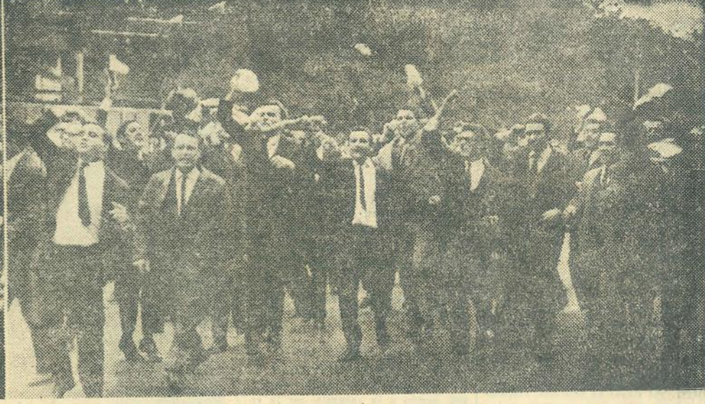
Dos Aspectos del Sepelio de la Señora Silvia M. de Illia

El féretro que contiene los restos mortales de la esposa del ex presidente de la Nación doctor Illia es conducido hacia la Recoleta tras la misa de cuerpo presente en la Iglesia del Pilar. El doctor Illia y sus hijos acompañando la carroza