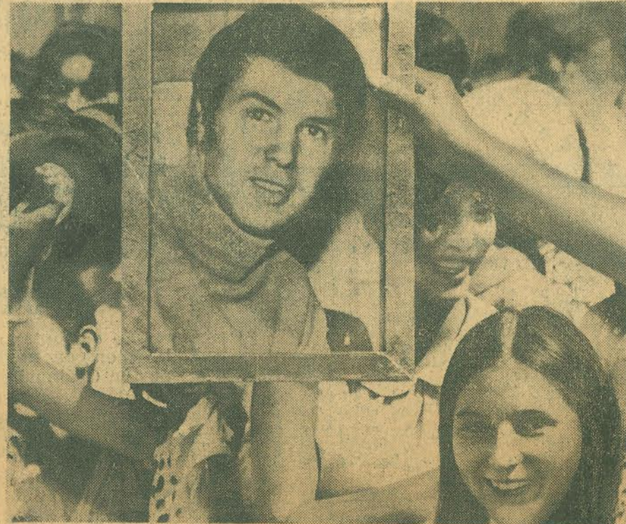
Sosteniendo en lo alto, un retrato de Salvatore Adamo, un grupo de admiradoras saluda al artista frente al Hotel Carrera. Desde tempranas horas cientos de jovencitas se instalaron en la Plaza de la Constitución para verlo