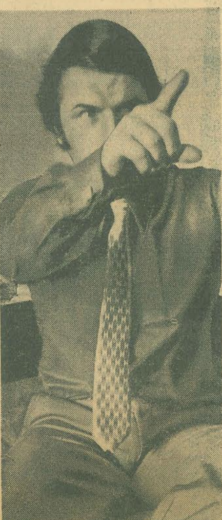
"El éxito lo descubrí en Chile"

POR ATAQUES CONTRA SUS AVIONES COMERCIALES.—