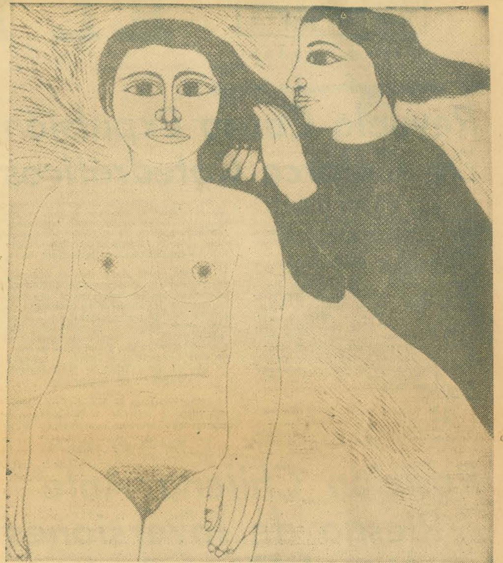
"Enamorada del viento", de José Santos Chávez